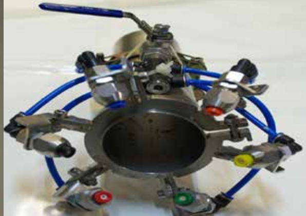
Transport- und Leihsystem