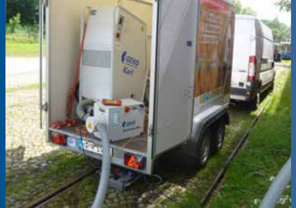
Anhänger Komplett Systemausstattung