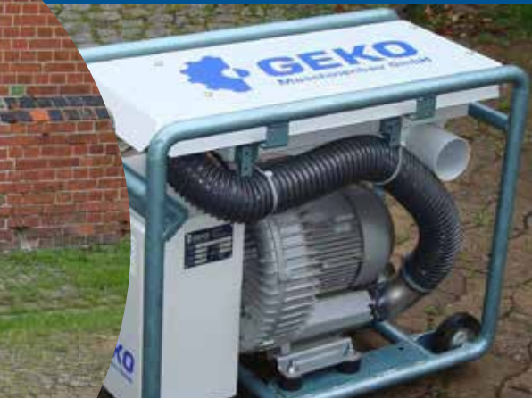
KYRILL Zusatzgebläse 400V